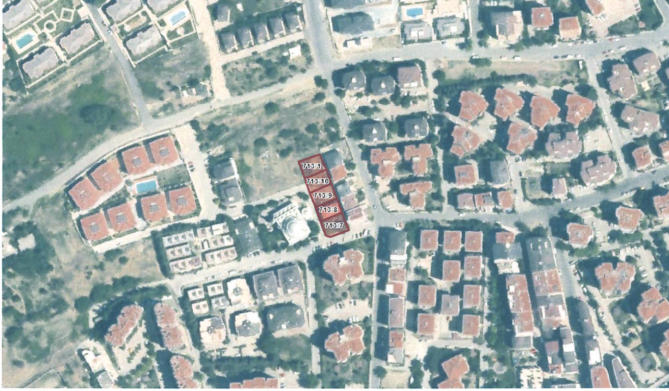
Şekil 1-Proje Alanını Gösterir Uydu Görüntüsü

Planlama alanı Tekirdağ İli, Süleymanpaşa İlçesi, Hürriyet Mahallesi sınırları içerisindeki 713 ada 1, 7, 8, 9 ve 10 parsel sayılı taşınmazları kapsamaktadır. Plan değişikliği teklifine konu Tekirdağ İli, Süleymanpaşa İlçesi, Hürriyet Mahallesi sınırları içerisindeki 713 ada 1, 7, 8, 9 ve 10 parsel sayılı taşınmazlar 1/1000 Ölçekli Tekirdağ Merkez Revizyon ve İlave Uygulama İmar Planında ‘Ayrık Nizam 2 Kat’ yapılaşma koşullarına sahip konut alanında kalmaktadır.